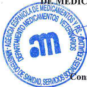
Consuelo Rubio Montejano