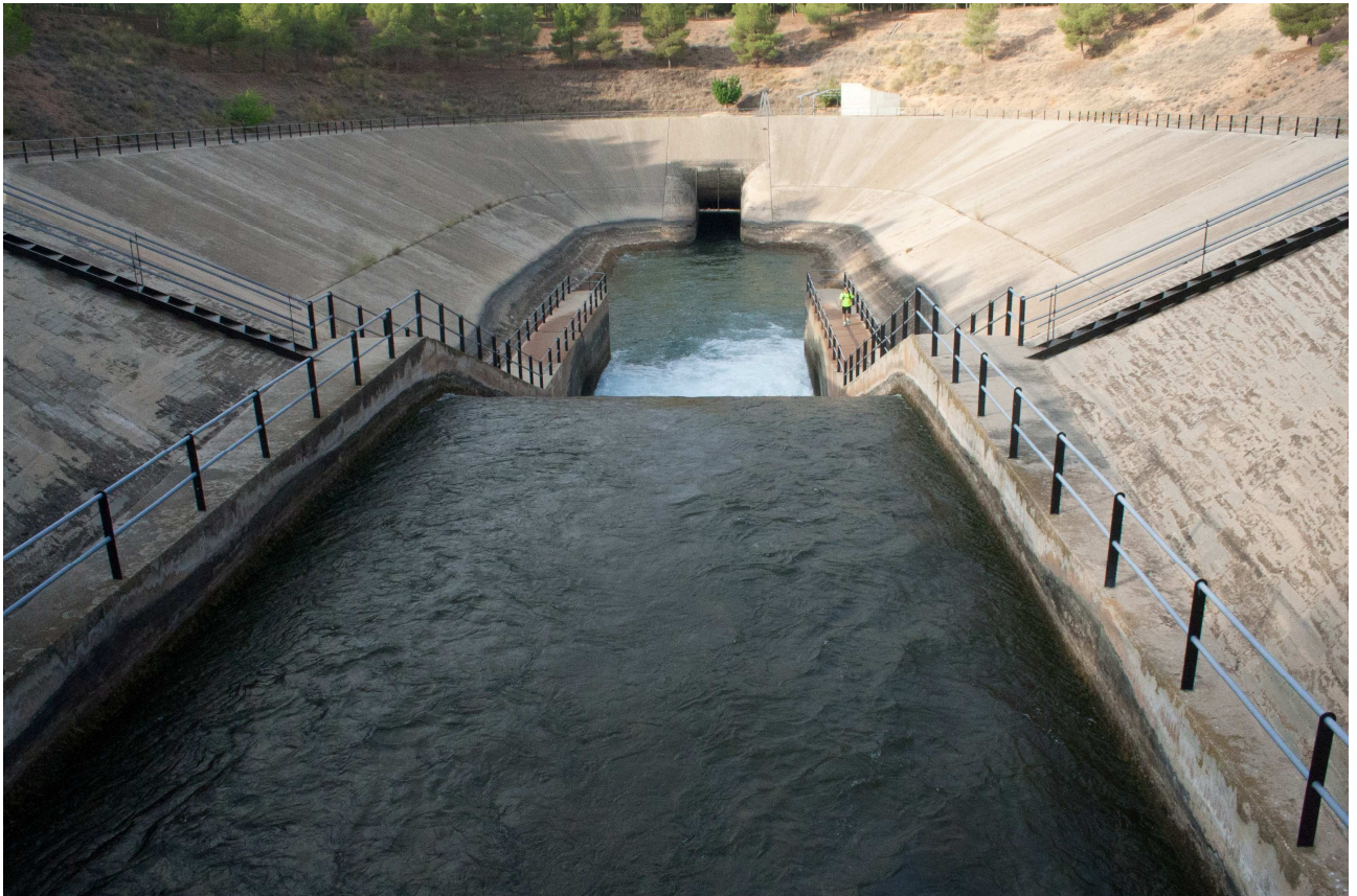
Túnel del Talave. Acueducto Tajo-Segura, Los Anguijes